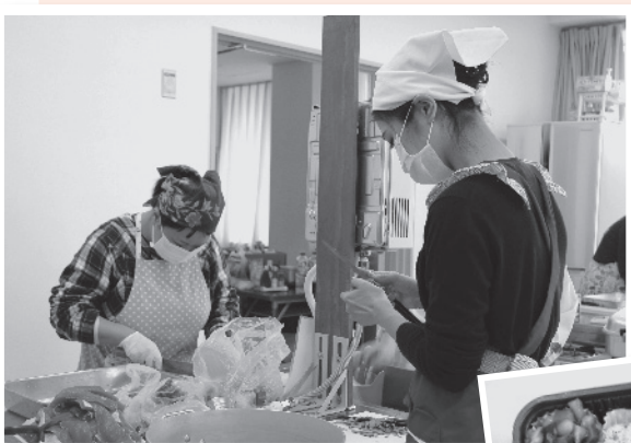
ふれあい会食会 ▲▶ 給食サービス

尚、会費は各自治会の役員さんを通して、4月27日～5月27日の間で集めさせていただきます。