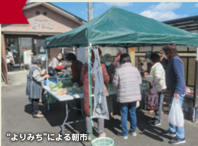
“よりみち”による朝市

また、壁面の展示作品『新聞紙アート』もとても好評で、「本当に新聞紙だけ?」「どうやって作るの?」と話されている声があちらこちらから聞こえてきました。