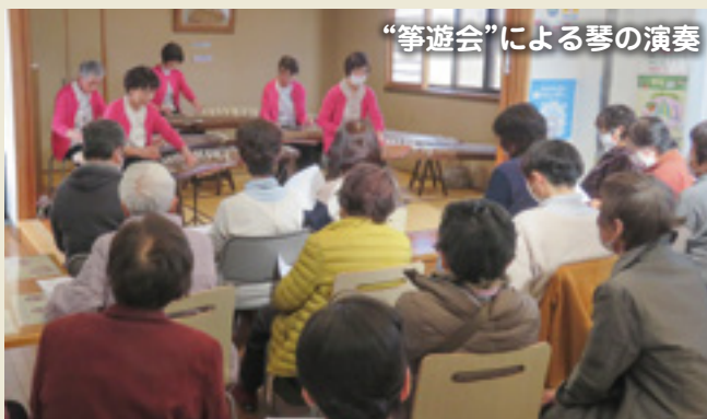
“箏遊会”による琴の演奏