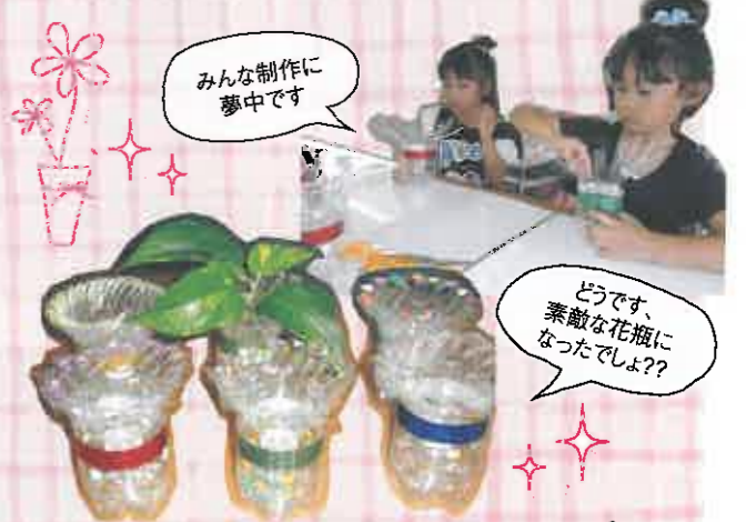
みんな制作に夢中です どうです、素敵な花瓶になったでしょ??