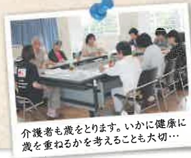
介護者も歳をとります。いかに健康に歳を重ねるかを考えることも大切...

二人一組で、背中をマッサージすることで、リラクゼーション効果を体験しました。介護者も歳を重ねるので、自身が高齢者となった時、自立した老後を送るためには何が必要かという視点で、いわゆる生活習慣病の予防方法や脱水症状の発見と予防、椅子からの立ち上がりや、ベッド上での体位交換の方法を学びました。介護を受けている人が、自分の力を使いながら、一部介助してもらって動く方法を知ることで、介護する側も介護される側も負担を減らし、充実した生活を送ることができるようになるということが実感できたと思います。