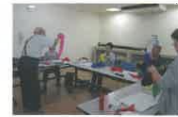
シルクのハンカチを使って...