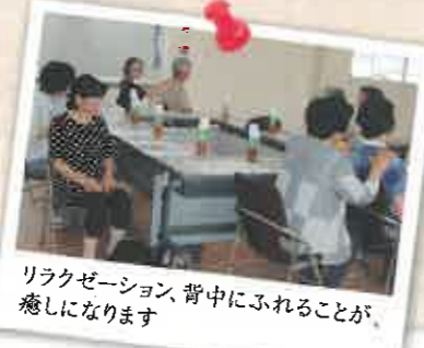
リラクゼーション、背中にふれることが、癒しになります