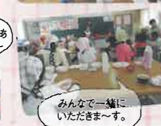
みんなで一緒にいただきます。