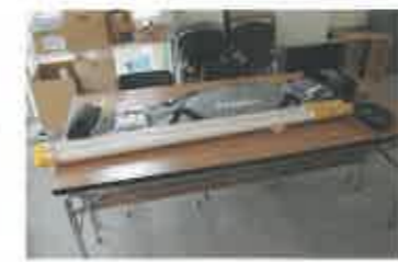
災害時、夜間のテント照明のために...