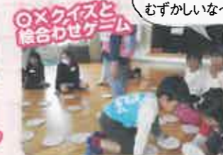
ちょっとむずかしいな～