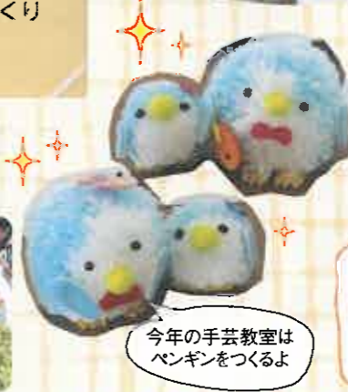
今年の手芸教室はペンギンをつくるよ