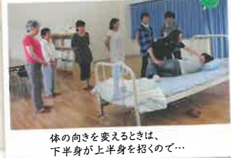
体の向きを変えるときは、下半身が上半身を招くので...