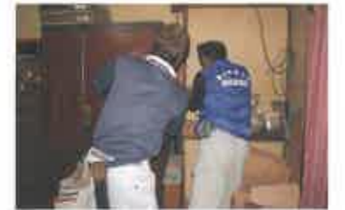
商工会建設業部会による家具固定作業