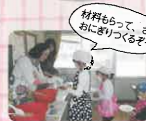
材料もらって、さあおにぎりつくろぞ～