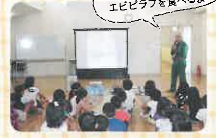
今年の防災教室はエビピラフを食べるよ