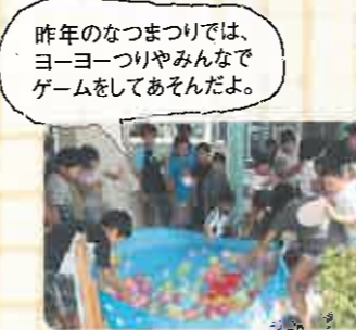
昨年のなつまつりでは、ヨーヨーつりやみんなでゲームをあそんだよ。