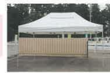
アルミ軽量の折りたたみテント持ち運びにも便利