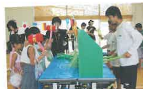
なつまつりのゲームの裏方 子どもたちが楽しめるように頑張りました