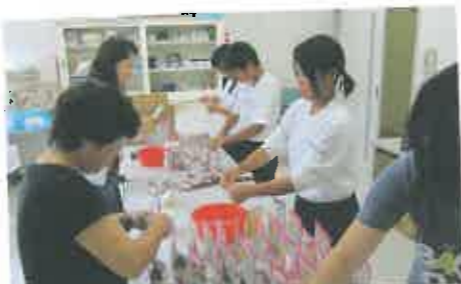
児童センターでの防災教室 非常食の準備を手伝いました

ンティアをして思ったことは、すごく大変だったけれど、その分小さい子がよるこんでくれたのでうれしかったです。外で暑かったですが、小さい子が楽しそうにしている、暑さなんて忘れてこっちまで楽しくなりました。