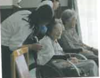
デイサービスでの入浴後の介助