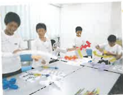
バルーンアート いろんな形ができあがり、とっても楽しかった!