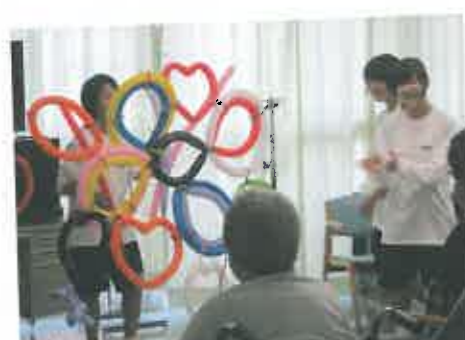
老健施設センター21 ゲームで楽しかったです。