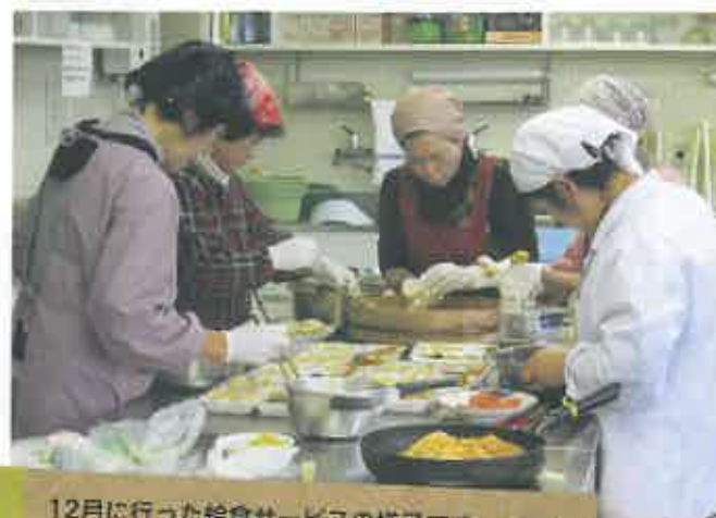
12月に行った給食サービスの様子です。あなたも、この事業に参加しませんか!