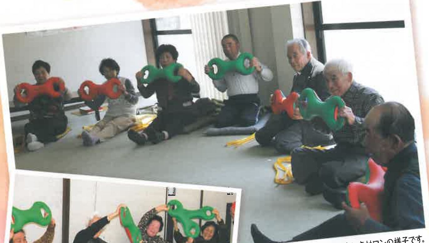
3月17日 榑洞でのふれあい・いきいきサロンの様子です。 みなさん、楽しそうでしょ！（関連記事 P4～P5）