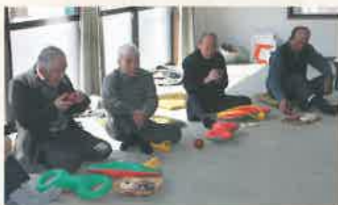
体を動かした後は、お茶とお菓子でおしゃべりの時間。