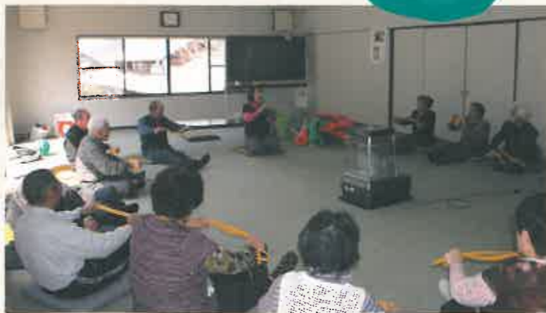
ペルターを使って「はい、縮めて～伸ばして～」