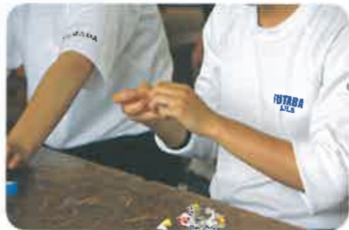
こうして、1個1個確認し、シールが張ってある物は、手作業ではがしていきます。