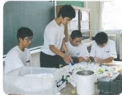
技術科教室に集まったボランティアの生徒さん達が各テーブルに分かれて、仕分け作業の開始です。