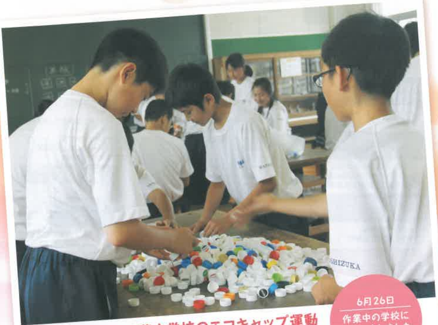
福祉協力校 双葉中学校のエコキャップ運動 集まったキャップを、手作業でより分けていきます。