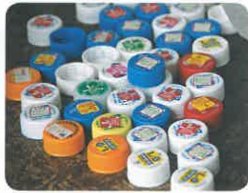
こんなシールの貼ってあるキャップがたくさんあります。