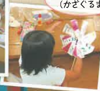
放課後児童クラブ (かざぐるま)