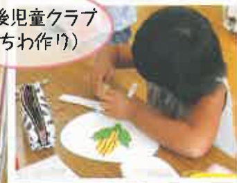
放課後児童クラブ (うちわ作り)