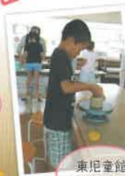
東児童館 (茶碗作り)