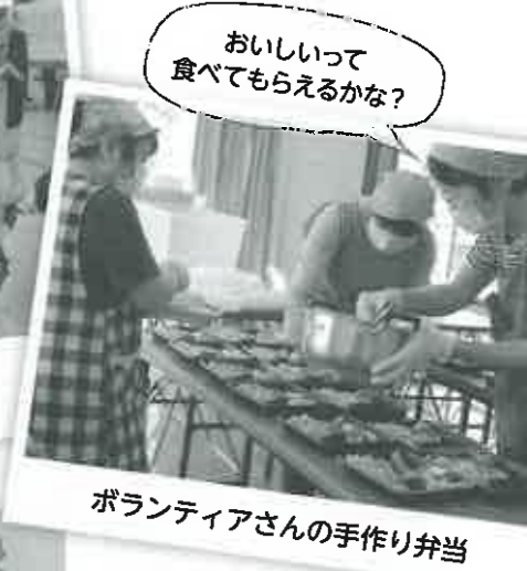
おいしいって食べてもらえるかな?