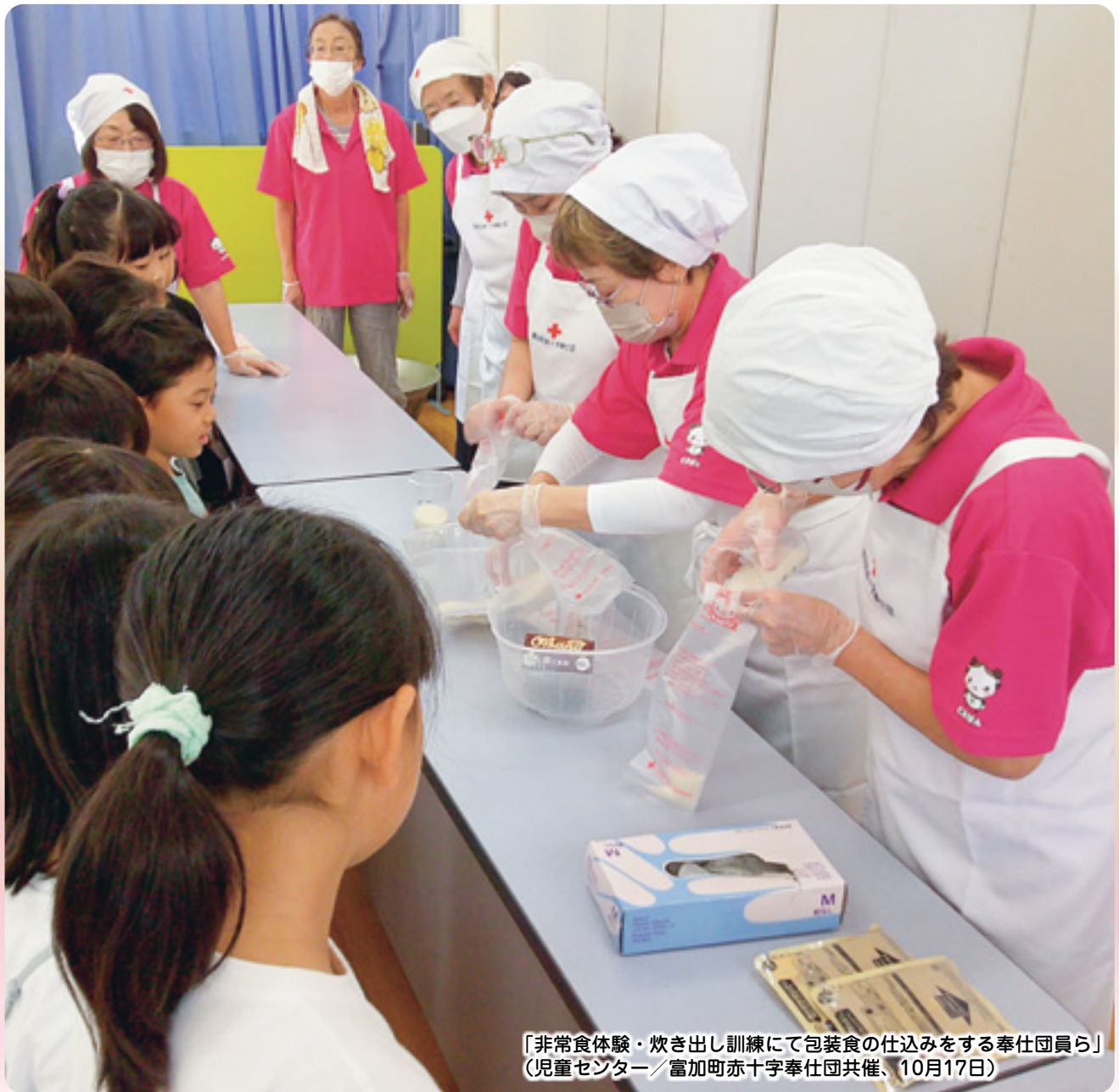
「非常食体験・炊き出し訓練にて包装食の仕込みをする奉仕団員ら」 (児童センター／富加町赤十字奉仕団共催、10月17日)