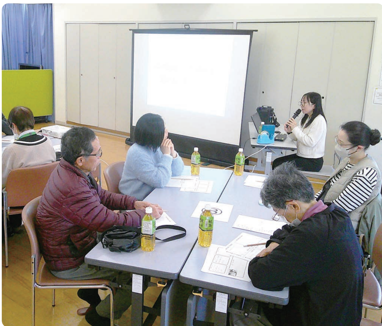
生活支援研修「メンタルセルフケア」の講話を受ける参加者ら(3月4日)